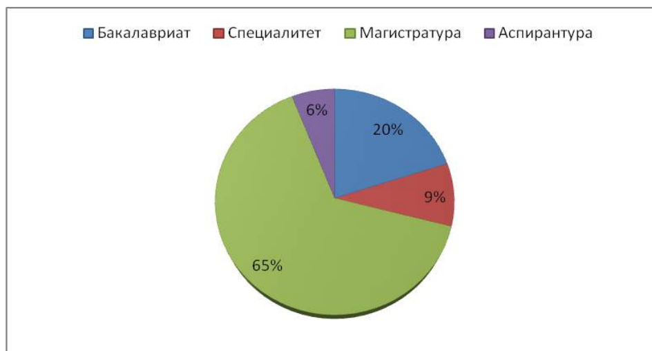
График 3. Распределение программ двойных дипломов по уровням образования

Большая часть программ двойных дипломов ведется на уровне магистратуры (65%), на бакалаврском уровне их значительно меньше (20%). Существуют и программы двойных дипломов на уровне специалитета (9%).