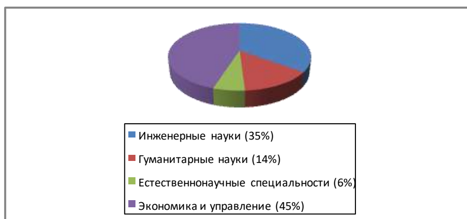
График 2. Распределение программ двойных дипломов по областям специализации

Большая часть программ двойных дипломов ведется на уровне магистратуры (65%), на бакалаврском уровне их значительно меньше (20%). Существуют и программы двойных дипломов на уровне специалитета (9%).